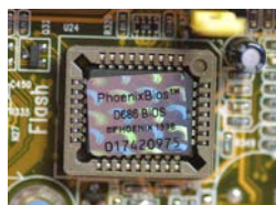
Рисунок 2 Чип “PhoenixBIOS”

В персональном компьютере все основные программы, предназначенные для начального запуска «железа», собраны в универсальную программу, которая записана в постоянном запоминающем устройстве (ПЗУ, ROM), носящем название BIOS (рисунок 2) – Basic Input/Output System (базовая система ввода/вывода).